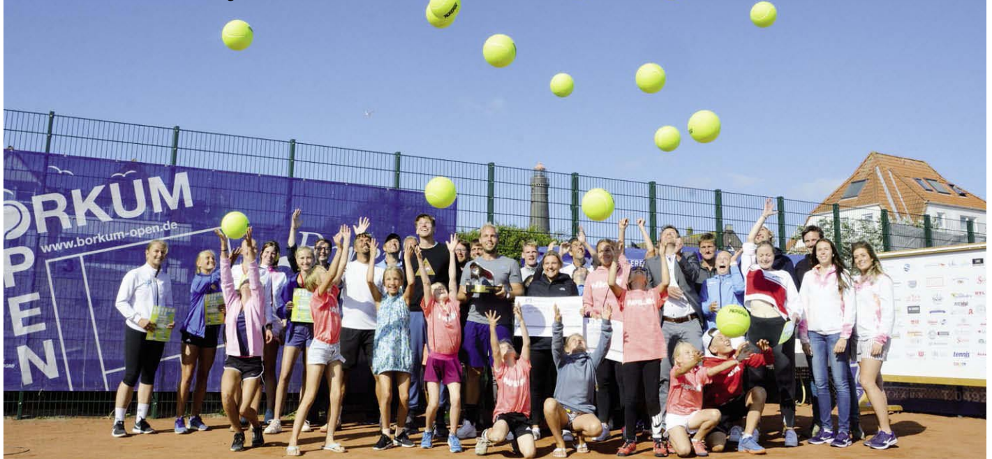
Abschlussfoto einer gelungenen Veranstaltung: Die Borkum Open haben über 4.000 Zuschauer auf die Tennisanlage gezogen.