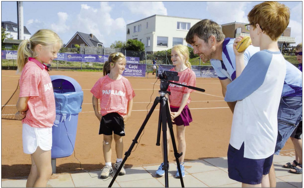
Die Balljungen und -mädchen hatten alle Hände voll zu tun: Insgesamt wurden über 800 Bälle verspielt.

BORKUM - Folgenreich war Donnerstagabend das Verhalten einer 41-jährigen Frau aus den Niederlanden. Die Mutter war gegen 15.30 Uhr mit ihrer sechsjährigen Tochter in der Strandstraße unterwegs. Besorgte Passan- ten hatten die Polizei infor- miert, weil die Frau stark schwankend lief und offen- sichtlich alkoholisiert war. Die Beamten führten einen Atem- alkoholtest bei der Mutter durch. Dieser lieferte ein Er- gebnis von 1,91 Promille. Etwa zeitgleich zur Sachverhalts- aufnahme gab eine Bürgerin eine aufgefundene Handta- sche bei der Polizeistation Borkum ab. Es handelte sich dabei um die Handtasche der 41-Jährigen. Diese hatte sie offenbar verloren oder verges- sen. Bei einer Nachschau in der Tasche fanden die Beam- ten eine Substanz, bei der es sich wahrscheinlich um Mari- huana handelt. Die Beamten leiteten ein Strafverfahren ge- gen die Mutter ein und stell- ten die Substanz sicher. Zu- dem informierten sie das zu- ständige Jugendamt, welches das 6-jährige Mädchen vor- erst in Obhut nahm.